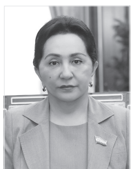
Танзила НОРБОЕВА, Ўзбекистон Республикаси Олий Мажлиси Сенати Раиси

Конституция ҳар қандай мустақил давлат тузилишини, ҳокимият, бошқарув органлари тизimini, уларнинг ваколат ҳамда шакллантирилиш тартиби, сайлов тизими, фуқароларнинг ҳуқуқ ва эркинликлари, жамият ва шахснинг ўзаро муносабатлари, шунингдек, суд тизими, давлат ҳамда жамиятнинг ўзаро муносабатларини белгилаб берадиган Асосий қонун сифатида муҳим аҳамият касб этади.